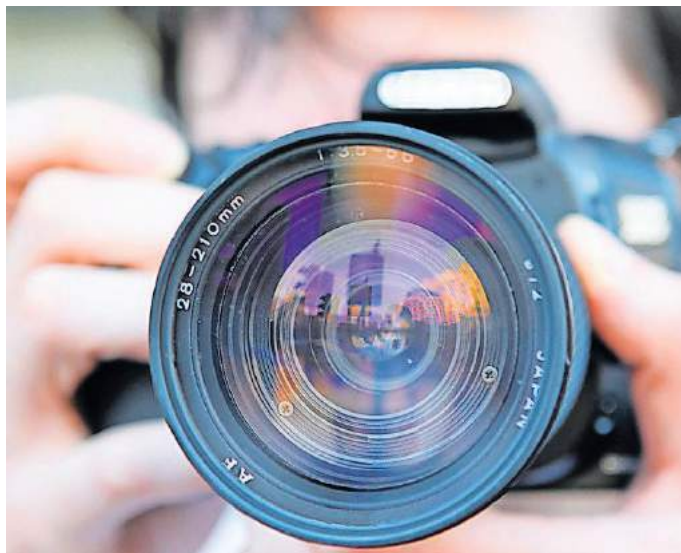
Fotografien der Gewinner des Fotowettbewerbs sind in der Staatskanzlei ausgestellt

Anlässlich des 75. Geburtstag des Landes Rheinland-Pfalz wurde die Ausstellung nun um Motive aus den Jahren 2008 bis 2021 ergänzt. Dafür hatte die Staatskanzlei im vergangenen Herbst einen Fotowettbewerb ausgerufen, an dem sich sowohl Laien- als auch Profifotografen beteiligen konnten. Aus fast 600 Ein-