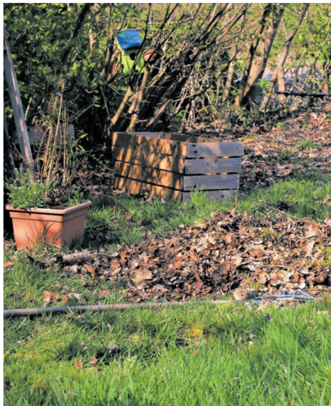
Platz schaffen für die neuen Triebe im Frühling

Rosen haben einen eigenen Terminplan: Wenn die gelben Forsythiensträucher ihre Blüten öffnen, ist es warm genug für den Rückschnitt. Generell entfernt man nun alle erfrorenen, kranken oder abgestorbenen Triebe. Der