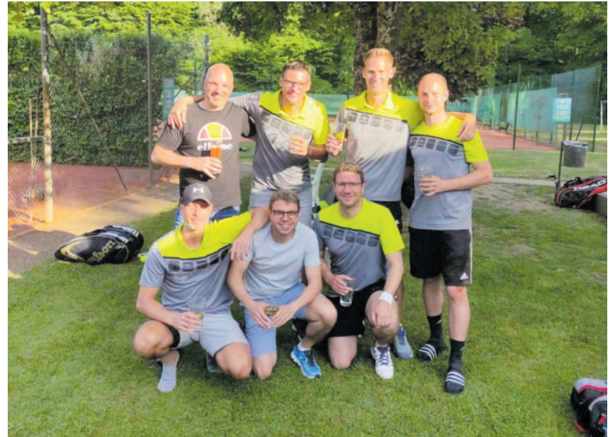
Die siegreiche Herren 30, 1. Mannschaft bei ihrem 2. Erfolg in der Pfalzliga in Kandel