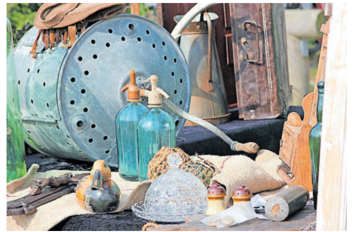
Hofflohmärkte sind der neue Trend

Handelt es sich um einen einmaligen Garagenverkauf auf dem eigenen Grundstück, ist dieser in der Regel unproblematisch. Den-