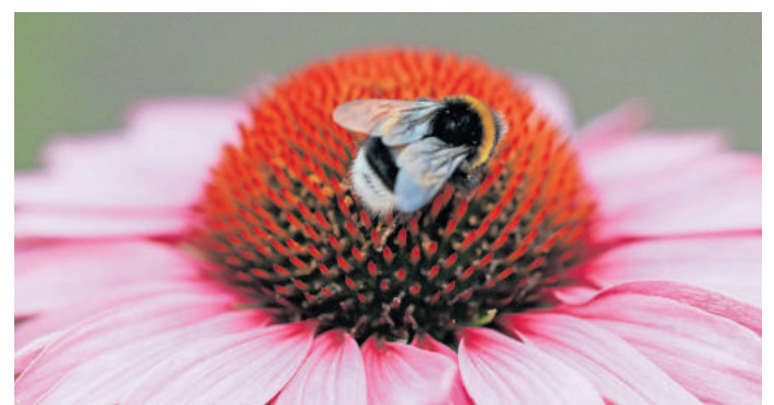
Nicht alle Blühpflanzen sind für Insekten geeignet

Um so wichtiger ist es, dass man auch im heimischen Garten oder auf dem Balkon etwas für die Insekten tun kann. Egal, wie viel Platz man hat: Mit der richtigen Pflanzenauswahl kann man