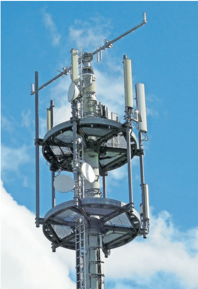
Die Ausweitung des Mobilfunknetzes in Rheinland-Pfalz geht voran