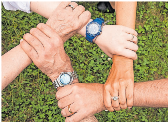
Die Kultur im Ahrtal erhält Förderung durch Stiftung

„Es ist beeindruckend, auf welcher unterschiedlichen Weisen sich die Projekte mit der schreck-