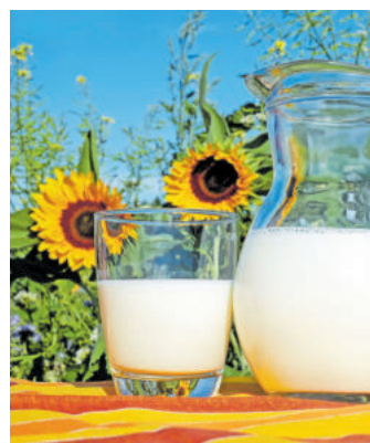
Zu einer ausgewogenen Ernährung gehören Milchprodukte