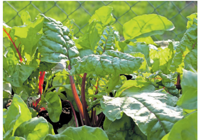
Gemüse aus der Römerzeit wieder entdeckt

Aromatischer Mangold mit wertvollen Vitaminen