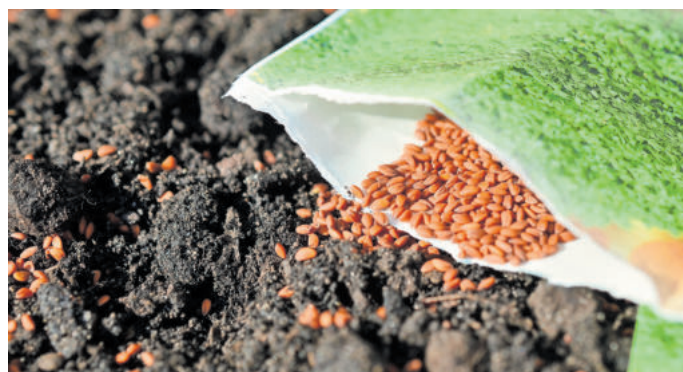
Bei Pflanzensamen gibt es große Unterschiede

Pflanzensamen sind nicht gleich Pflanzensamen, weiß die BUND-Vertreterin: „Pflanzensamen werden praktisch fast überall angeboten. Die Unterschiede sind jedoch enorm. Zu empfehlen sind in jedem Fall samenfeste Sorten. Denn von diesen Pflanzen kann aus der Frucht wieder Saatgut für das nächste Jahr gewonnen werden. So kann man sich seine Lieblingssorten selber vermehren.“ Wenn „F1“, auf dem Samentütchen steht, handelt es sich um Hybridsorten, die durch Kreuzung zweier unterschiedlicher Sorten entstehen. Dieses Saatgut kann von Gärtnern nicht