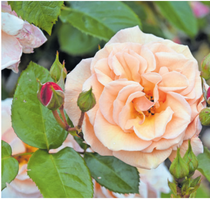
Die Königin der Blumen ist eine ideale Gartenpflanze