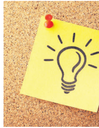
Bilder helfen dem Gedächtnis auf die Sprünge