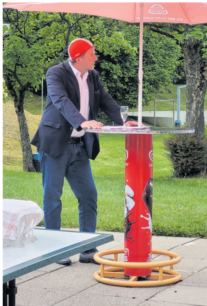
Bürgermeister Christoph Lothschütz während seiner Rede zur Eröffnung des Freibades Waldmohr. Mit Retro-Bademütze würdigt Christoph Lothschütz den 50. Geburtstag des Freibades und erinnert damit an die Badeordnung bei der Eröffnung im Mai 1972.

Nutzen Sie die Möglichkeit öffentlicher Verkehrsmittel zum Besuch des Schwimmbades und achten Sie bei der Anfahrt mit dem privaten PKW für die Freihaltung der Rettungswege in der Badstraße.