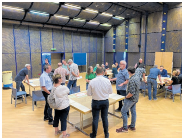
Runde Thementische zum Klimaschutz

Um diesen Informationsbedarf und das Interesse der Bürger:innen noch besser einschätzen zu können, aber auch um weitere Maßnahmenvorschläge zu sammeln, hat die Verbandsgemeinde eine Umfrage zum Thema Klimaschutz auf ihrer Homepage veröffentlicht. Alle Bürger:innen werden gebeten an der etwa zehn Minuten dauernden Umfrage teilzunehmen. Mit der Teilnahme wird ein wertvoller Beitrag geleistet, um den Klimaschutz in der Verbandsgemeinde weiter voran zu bringen. Die Umfrage ist bis zum 30.06.2022 frei geschaltet und aufrufbar unter www.vgog.de