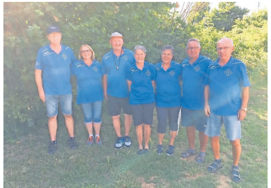
Unser Bild zeigt die Regionalliga-Mannschaft des SV Kübelberg