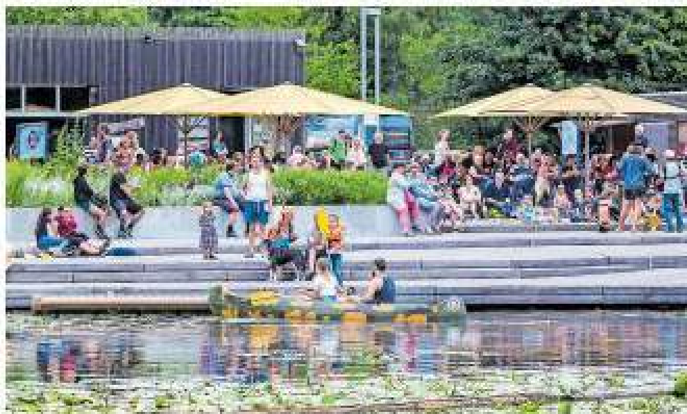
Die Willi Villa liegt direkt am Wasser im Wilhelmsburger Inselpark.