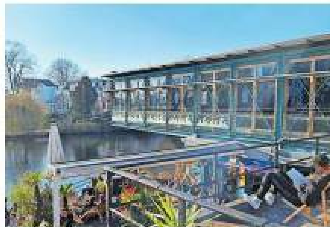
Von der Monkey Beach Bar blickt man auf den Alsterkanal, der Innenbereich des Restaurants schwebt teils über dem Wasser.