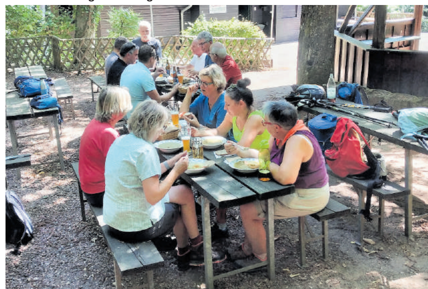
Die Hüttenwanderung zwischen St. Ingbert und Oberwürzbach war die optimale Tour an dem heißen Sonntag. Es ging über walddreiche Pfade vorbei an zahlreichen Brunnen und