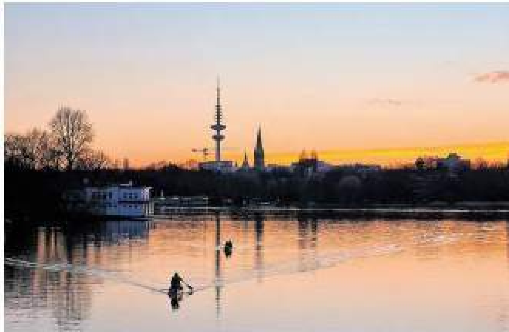
Romantische Abendstimmung an der Außenalster: Was für eine Kulisse für die Kajak-Runde.