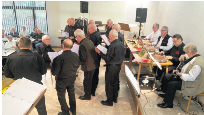
Männergesangsverein Brücken- Gries mit der Zithergruppe aus Brücken (Pfalz)