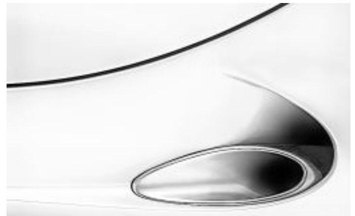
Reiner Spiegel - Auspuffdesign

In den Räumen des Landesamtes für Straßenbau und Verkehr wurden die Gäste mit einem Glas persönlich in Dresden in Empfang genommen. „Das war eine großartige Werbung für unseren