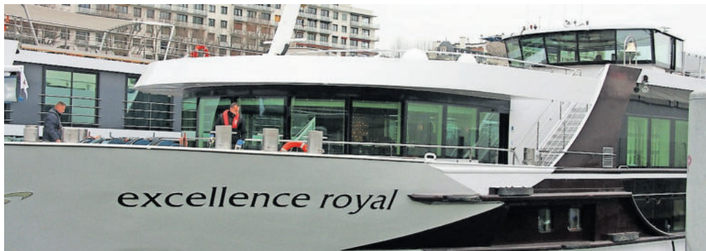
Mit der MS Excellence Royal geht es gemeinsam über die Seine durch Frankreich

Mit dem Flusskreuzfahrtschiff über die Seine