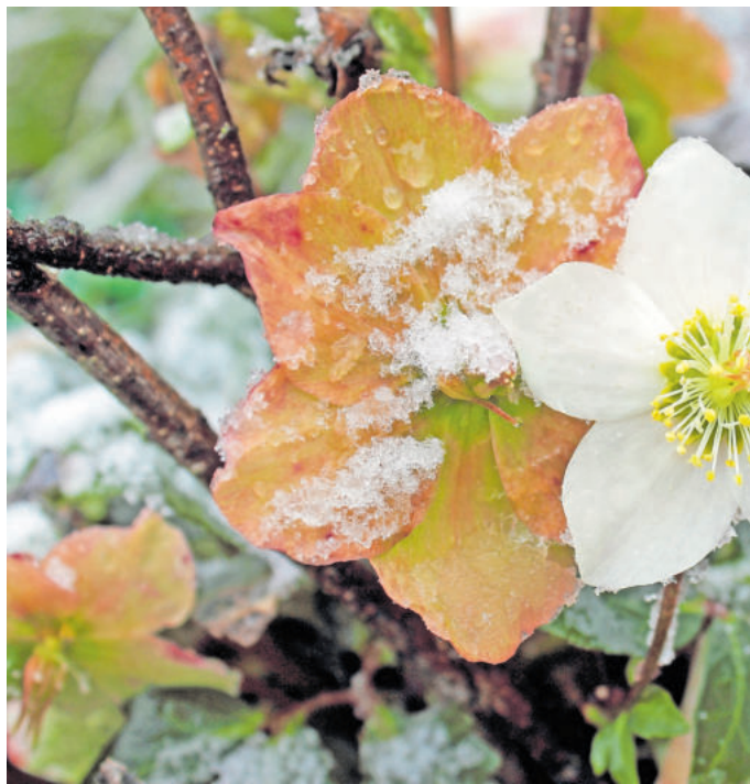
Ein Vertreter der Winterblüher ist die Pfingstrose

Wer jetzt Lust auf Winterblüten bekommt, kann die Sträucher an frostfreien Tagen im Garten pflanzen. In den ersten Jahren sollte man sie allerdings mit etwas angehäuftem Laub oder Reisig vor Frost schützen. Dabei kommt es auf die richtige Standortplanung an. Die Gartenprofis der Initiative erklären das ganz praktisch: „Im Winter verbringt