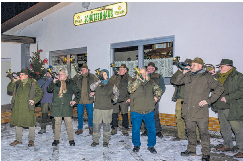
Jagdhornbläser der Kreisgruppe Kusel