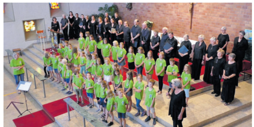
150-Jahr-Feier: Madrigalchor und Ethno-Chor Kids