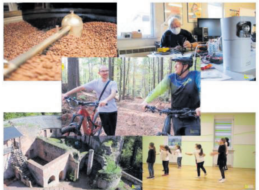
Ausschnitte aus der Abschlussdokumentation der LAG Westrich-Glantal

Im Zuge der Mitgliederversammlung fand auch die Neuwahl des Vorstandes statt. Eine Arbeitsgruppe betreut den Übergang von der bisherigen zur neuen Förderperiode, die am 01. Juli startet. Alle bis dahin bewilligten Projekte werden auch nach dem 01. Juli noch zum Abschluss gebracht. Mit der neuen Förderperiode erweitert sich das Gebiet der LEADER-Region Westrich-Glantal um die Verbandsgemeinden Kusel-Altenglan und Weilerbach. Nach dem Start der neuen Förderperiode wird auch zeitnah ein neuer LEADER-Projektauftrag gestartet, auf den sich dann Projektträger der neuen Gebietskulisse bewerben können.