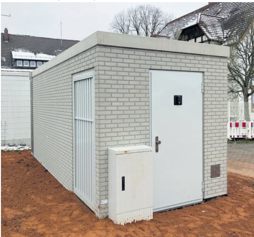
Beispielfoto des PoP in Schönenberg-Kübelberg

Auch während der Bauphase können interessierte Bürgerinnen und Bürger noch Verträge zu Sonderkonditionen abschließen. Informationen erhalten sie persönlich im Servicepunkt von Deutsche Glasfaser (Glanstraße 28, 66901 Schönenberg-Kübelberg, Montag und Dienstag: 11:00 – 13:00 Uhr und 14:00 – 18:00 Uhr), telefonisch unter 02861 - 890 600 oder online unter www.deutsche-glasfaser.de . Fragen zum Bau beantwortet zudem die kostenlose Deutsche Glasfaser Bau-Hotline unter 02861 890 60 940 montags bis freitags in der Zeit von 8 bis 20 Uhr.