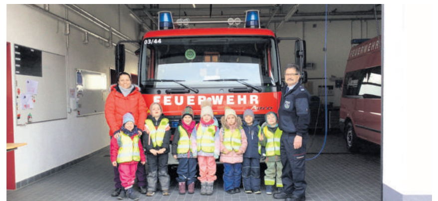
Ein Morgen bei der Feuerwehr. Am 17. Januar 2023 besuchte die Schmetterlingsgruppe die Breitenbacher Feuerwehr. Bei etwas Theorie lernten die Kinder altersgerecht das