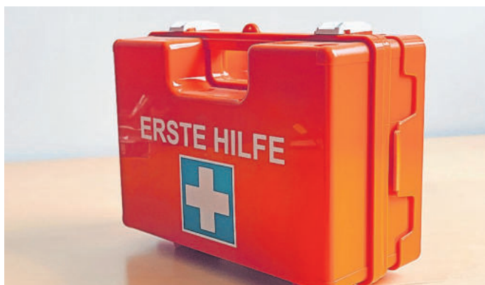
Erste Hilfe: Bei Verdacht auf Herzinfarkt sofort 112 rufen

Faktencheck. Ein Kettenbrief auf Whatsapp empfiehlt „starkes Husten“ als Erste-Hilfe-Maßnahme bei einem Herzinfarkt. Medizinische Fachleute widersprechen: Husten sei bei einem Herzinfarkt nicht wirksam und unter Umständen sogar gefährlich.