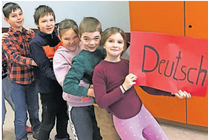
Es bedarf nicht immer vieler Worte, um sich miteinander zu verständigen

Hauptziel des Projekts war, neben der Intensivierung der Integration, vor allem den Kindern mehr Selbstwertgefühl zu geben.