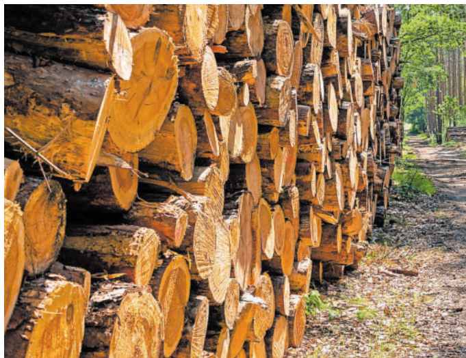
Die Nachfrage nach Brennholz aus heimischen Wäldern ist hoch

„Aufgrund der zunehmenden Forderungen seitens Umweltverbänden und der Politik, dass Holz