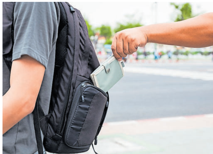
Die Wertsachen sollte man immer im Blick haben

Bei Verlust schnell die Zahlungskarten sperren. Über den Sperr-Notruf 116 116 ist das für alle girocards und die meisten Kreditkarten rund um die Uhr