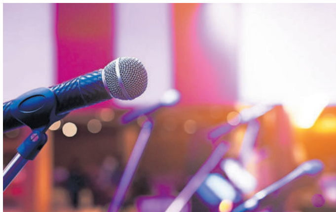
Mit dem KulturPass soll jungen Menschen der Zugang zur Kultur ermöglicht werden

Zum Start der Registrierung der Kulturanbietenden erklärt die Pfälzer Bundestagsabgeordnete Misbah Khan (Grüne): Die Registrierung läuft über eine digitale Plattform, auf der die Anbietenden ab jetzt sich registrieren und ihre Angebote anlegen können. Theater und Kinos, Konzert- und Opernhäuser, Buchhandlungen und der Musikfachhandel, Comic- und Plattenläden, Museen und Gedenkstätten, Parks, Botanische Gärten und Schlösser - sie alle können mit ihrem Angebot Teil des KulturPass sein. Der Preis für die genutzten Leistungen wird den Anbietern im Nachgang erstattet. Für die 18-Jährigen wird der KulturPass ab Mitte