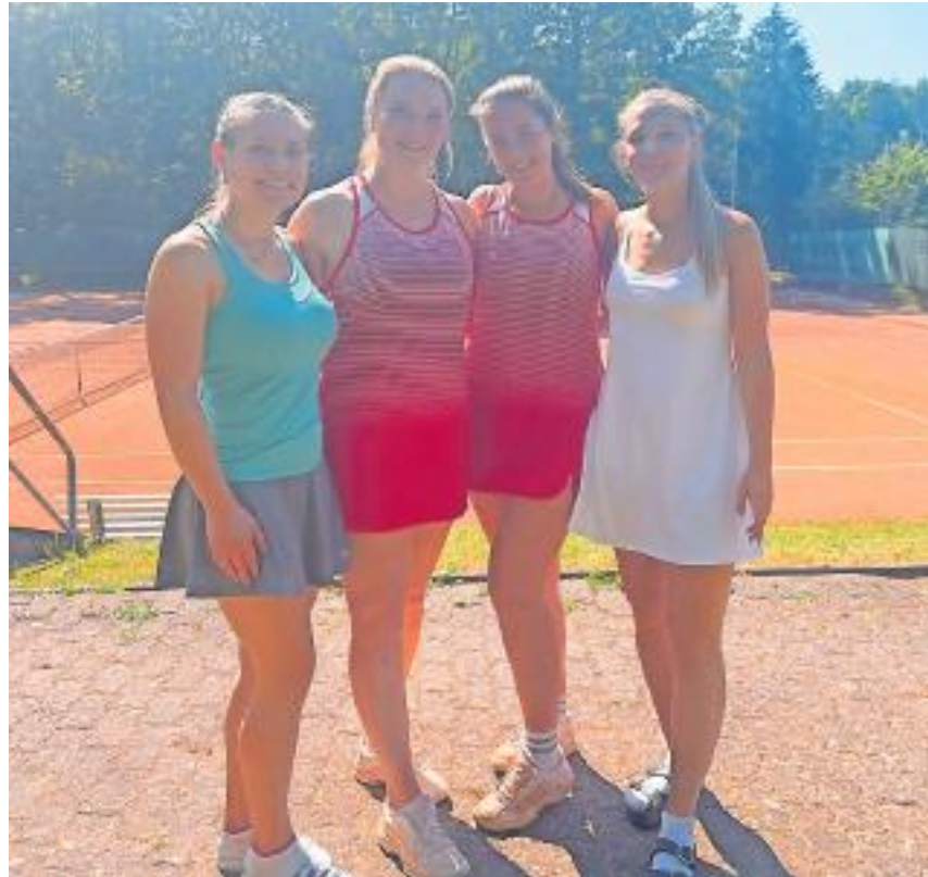
Die in Maasweiler erfolgreichen Damen