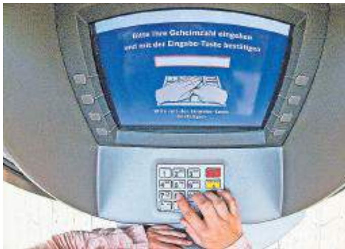
Bankautomaten im Freien sollte man meiden

Sicherheit. Mit einer Mischung verschiedener Zahlungsmittel treffen Reisende im Ausland immer die richtige Wahl. Ins Gepäck gehören ein wenig Bargeld und die girocard sowie - je nach Reiseziel - eine Kreditkarte. Mit beiden Karten kann man sich am Geldautomaten vor Ort Bargeld beschaffen. Dabei ist es ratsam, Geldautomaten innerhalb von Bankgebäuden und während der Öffnungszeiten zu nutzen. Dann steht im Notfall gleich eine Kontaktperson zur Verfügung. Automaten, die im Freien stehen, sollten aus Sicherheitsgründen eher gemieden werden. Oftmals bieten sie keinen ausreichenden Sichtschutz und sind anfälliger