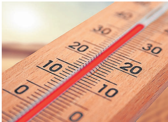
40 Grad Celsius wurden in Essen erstmals 2019 gemessen

Faktencheck. Auf Facebook kursiert seit Jahren eine Bild-Schlagzeile von August 1975 über „40 Grad Hitze“ in Deutschland. Dadurch soll der Eindruck erweckt werden, dass der Klimawandel „erfunden“ sei. Ein Faktencheck.