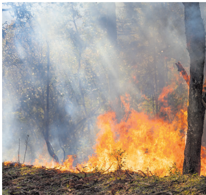
Damit beim Campen kein Waldbrand entsteht

Bei der Montage ist darauf zu achten, dass der Feuerlöscher immer einen festen Platz hat. „Fester Platz“ ist im doppelten Sinne zu verstehen. Der Feuerlöscher ist mit entsprechenden Halterungen zu montieren und sollte gut erreichbar sein. Optimal ist die Befestigung in der Nähe der Eingangstür, hierdurch ist der Feuerlöscher sowohl von au-