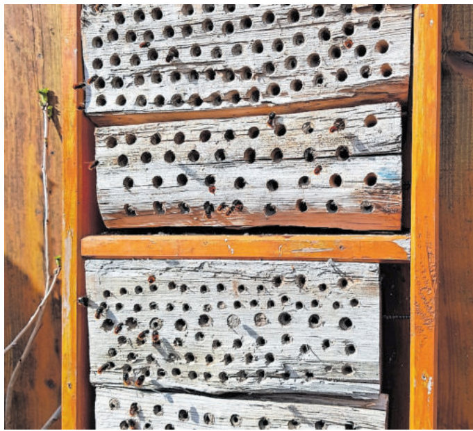
Einfache Nisthilfen für Wildbienen selbst bauen

„Viele Menschen haben Kräuter in ihrem Garten oder auf dem Balkon. Lassen Sie die einfach blü-