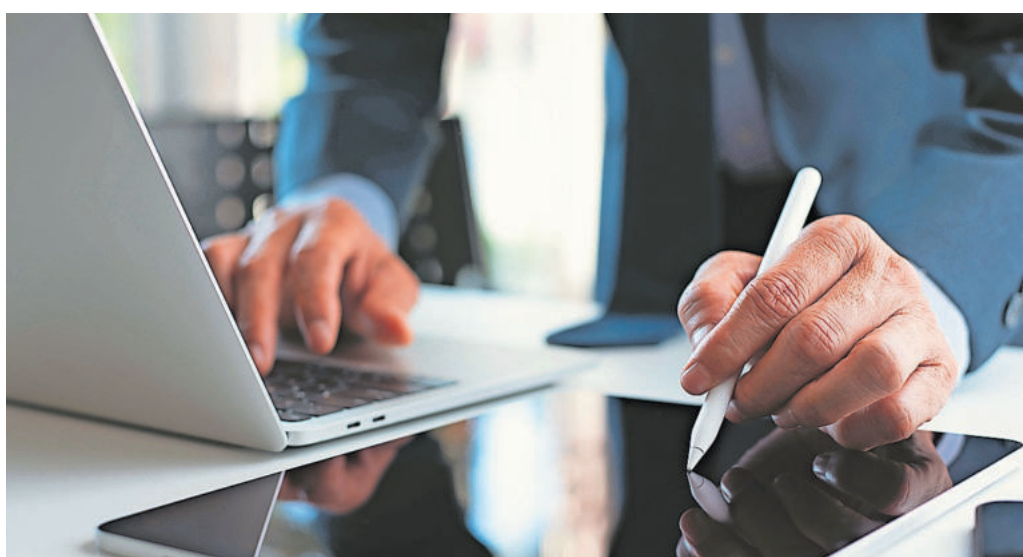
Eine sorgfältige Prüfung der Kontobewegungen ist ratsam

Wer unberechtigte Abbuchungen feststellt, sollte sofort seine Bank oder Sparkasse kontaktie-