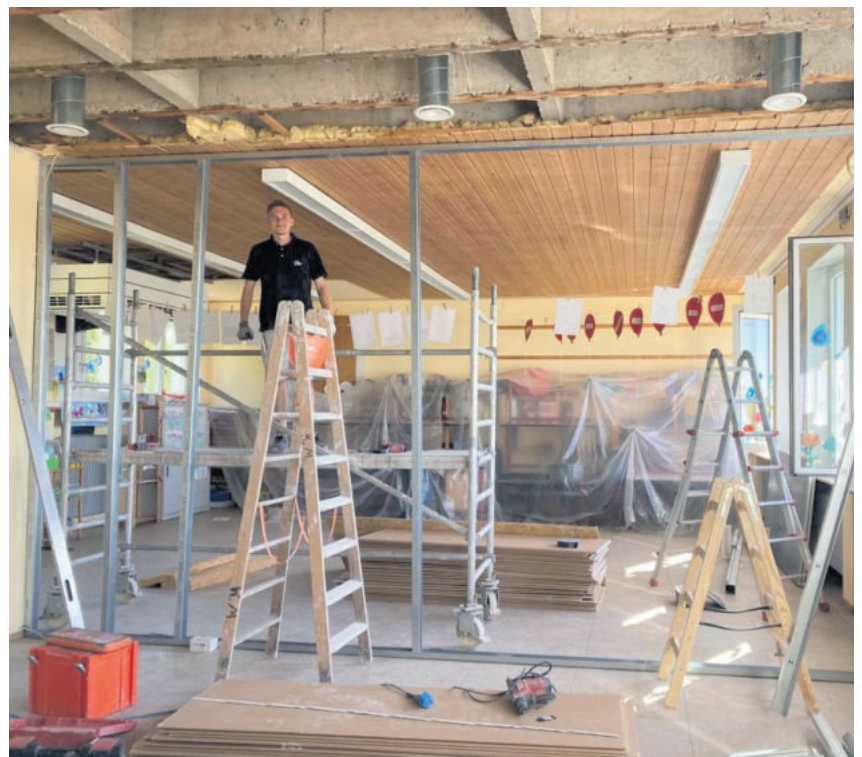
Gebäude der Grundschule Schönenberg-Kübelberg. Einbau einer neuen Trennwand zwischen zwei Räumen, für einen zukünftig genutzten Klassenraum.