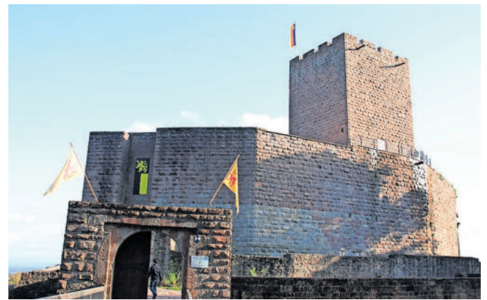
Ein kulturelles Erbe ist die Burg Landeck bei Klingenstein