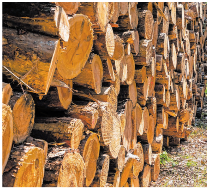
Brennholz fällt bei der Durchforstung der Wälder an

Der CO2-Kreislauf besagt, dass das beim Heizen mit Holz freigesetzte Kohlenstoffdioxid wiederum von nachwachsenden Bäumen aufgenommen wird, sodass ein geschlossener Kreislauf entsteht. Beim Heizen mit Brennholz wird nur so viel Kohlenstoffdioxid freigesetzt, wie auch beim natürlichen Zersetzungsprozess von Holz im Wald entstehen würde. Zudem wird in Deutschland