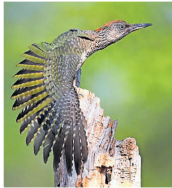
Gebadeter Grünsprecht von Konrad Funk

Eine extrem harte Nuss, insbesondere wenn sich wie 2023 Teilnehmer aus 47 Ländern bewerben. Dem erfahrenen Naturfotografen Konrad Funk vom Foto-