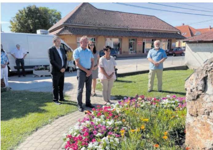
Kranzniederlegung am Manfred-Hofstätter-Platz

Freitags vor dem Kochwettbewerb fand eine Kranzniederlegung am „Manfred-Hofstätter-Platz“ statt.