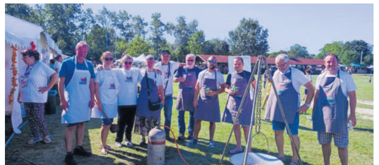
Vertreterinnen und Vertreter der Verbandsgemeinde Oberes Glantal beim Kochwettbewerb

So begann samstagsmorgens in der Früh ein Kochwettbewerb mit ca. 30 teilnehmenden Gruppen, bei dem sich alles „rund um das Huhn“ drehte. Eine Delegation aus unserer Verbandsgemeinde kochte eine Hühnersuppe nach deutschem Geschmack