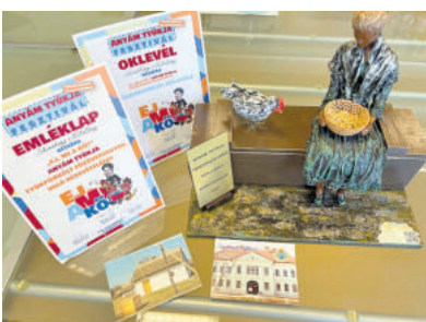
Wanderpokal und Teilnehmerurkunde

und bringt einen Wanderpokal mit ins Rathaus der Verbandsgemeinde Oberes Glantal mit.