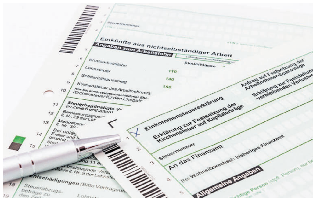
Wer seinen Steuerbescheid schon erhalten hat, sollte ihn unbedingt überprüfen

Nach einer aktuell veröffentlichten Statistik des Bundesfinanzministeriums (BMF) erreichten 2022 fast drei Millionen Einsprüche die deutschen Finanzämter. Hinzu kommen rund 2,6 Millionen unerledigte Einsprüche aus den Vorjahren, von denen die