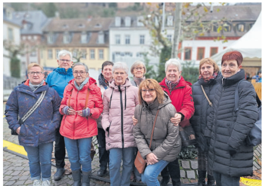
Unser Bild zeigt die Helferinnen der Ausgabestelle in Brücken bei einem Ausflug

Berechtigungsscheine zum Einkauf bei der Tafel erhalten Sie bei der Verbandsgemeindeverwaltung Oberes Glantal (Rathaus Schönenberg-Kübelberg). Auskünfte zur Berechtigung auch unter soziales@vgog.de oder den Telefonnummern: 06373-504 -201, -205 und -206.