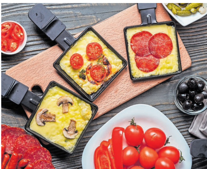
Raclette ist ein beliebtes Festessen

Die Experten der Initiative „1000 gute Gründe“ empfehlen