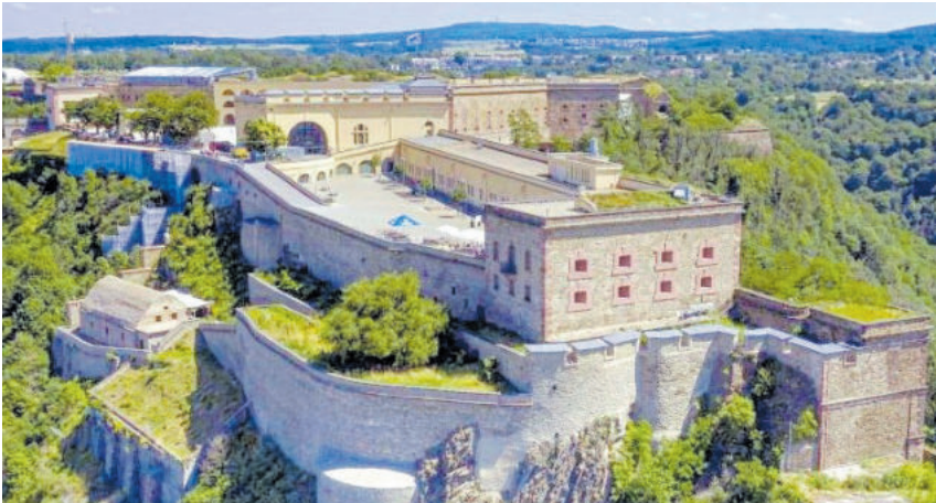
Bereits in Planung für 2024. Erlebnisfreizeit mit Übernachtung in der Jugendherberge in der Festung Ehrenbreitstein.

Wir wünschen allen Besuchern und deren Eltern sowie allen Freunden und Unterstützern des Jugendhauses Zuversicht und ein gutes neues Jahr.