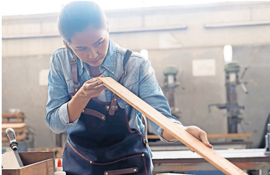
Frauen stehen ihren Mann, zum Beispiel als Tischlerin

Bei diesen vermeintlichen „Männerberufen“ handelt es sich meist um solche aus dem natur-