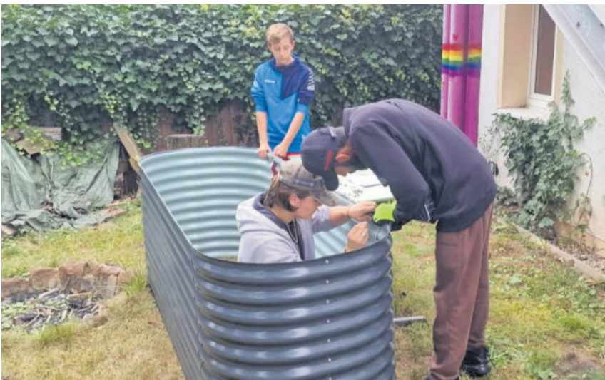
Eines der zahlreichen Projekte: Besucher beim Bau eines Hochbeetes, das in diesem Jahr die Koch AG mit frischen Kräutern und Gemüse versorgen wird.