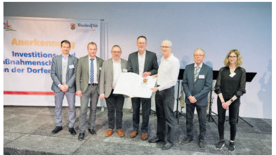
Innenministerium RLP/Stephan Dinges

Siedlungs- und Kulturlandschaft erhalten. Dazu zählen insbesondere auch Maßnahmen, die etwa der sozialen Daseinsvorsorge oder dem Klimaschutz dienen.